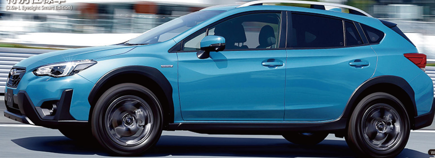
PHOTO: ラグーンブルーパール、ラダータイプブルーレール&シガーフィンアンテナ、運転席助手席両8ウェイパワーシート、運転席シートポジションメモリー機能+リバース連動トアマラー+トアマラーメモリー+8オート格納機能、アイサイトセーフティプラス(運転支援/視界拡張)はメーカー装着オプション(187,000円高・消費税10%込)

NEW 特別仕様車 (2.0e-L EyeSight Smart Edition)