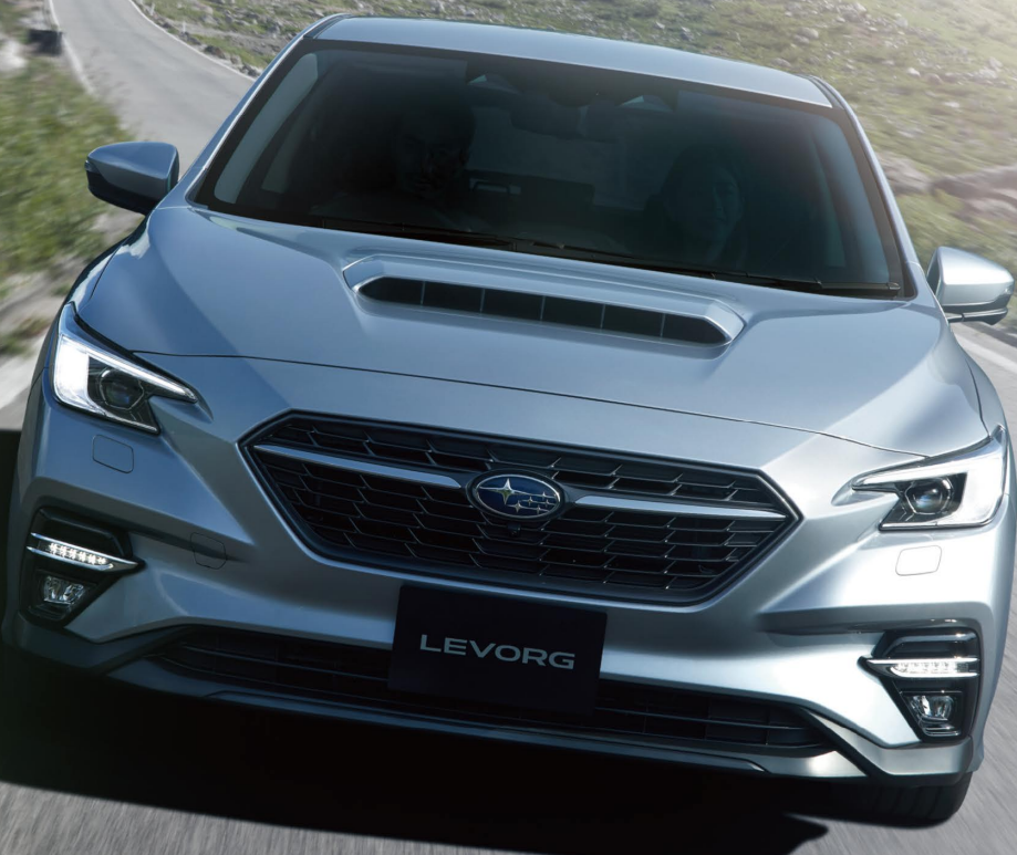
PHOTO: アイスシルバー・メタリック スマートリヤビューミラーはメーカー装着オプション(55,000円高・消費税10%込) LEDアクセラレーターライナーはディーラー装着オプション(54,780円高・消費税10%込)