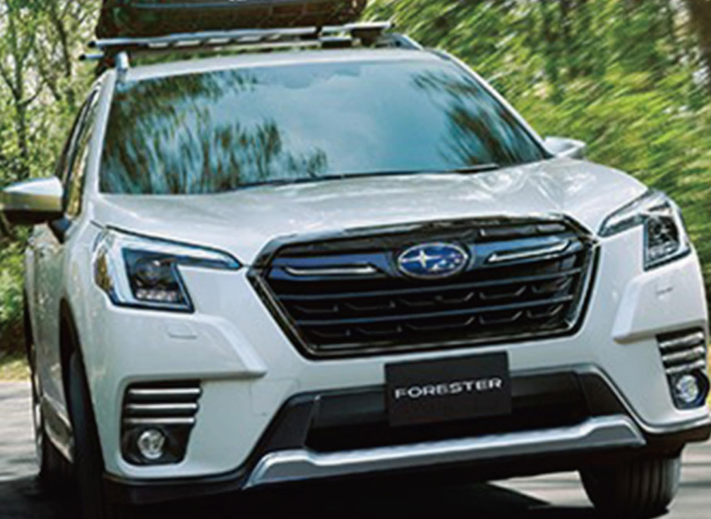
PHOTO: Advance クリスタルホワイトパール(83,000円高・消費税10%込) ルーフレーン(ルーフホール付)はメーカー装着オプション THULEシステムキャリアベース&ルーフバスケットはディーラー装着オプション